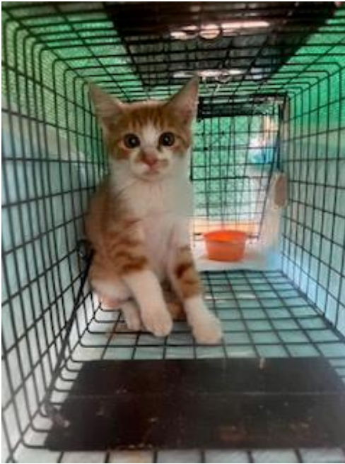
保護時のみろく 2023. 6