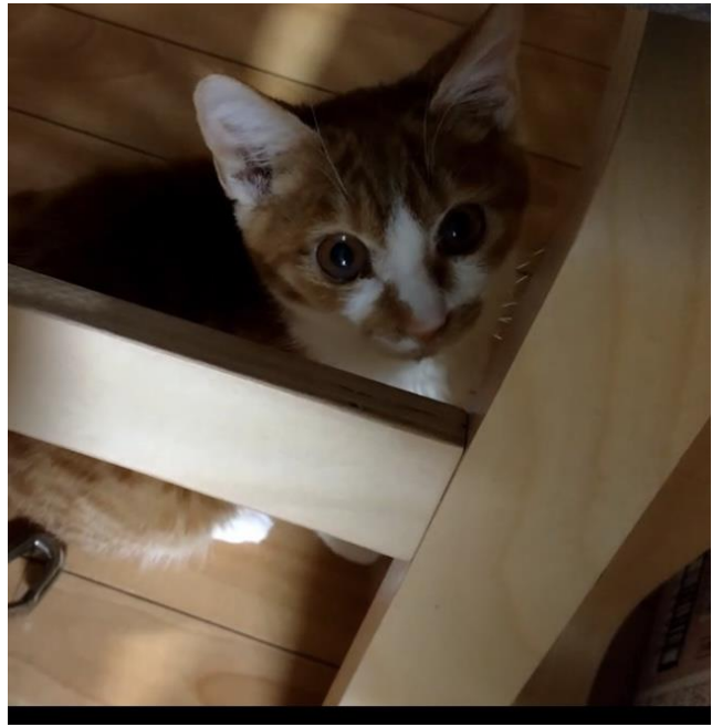
発症時のみろく 2023. 11

あいねこの保護猫みろくちゃんは FIP（猫伝染性腹膜炎）に感染発症し、現在投薬治療を行なっています。